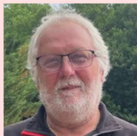
Agent polyvalent au service technique Arrivé le 13 janvier (remplacement)