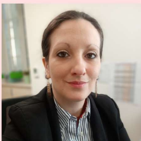
Agent polyvalent administratif Arrivée le 22 avril